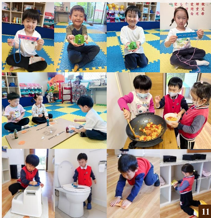
圖11：手工摺紙、美食製作及習勞等課程都能鍛煉動手能力。

手工摺紙課程鍛煉了同學們手眼協調能力、手部的靈巧度，課程穿插剪紙、摺紙、摺手帕、塗色、握筆訓練、色彩搭配等內容，在老師的耐心引導和示範下，同學們逐步學會簡單的摺紙、體驗不同材質的觸感、辨認不同顏色、畫出簡單形狀等。