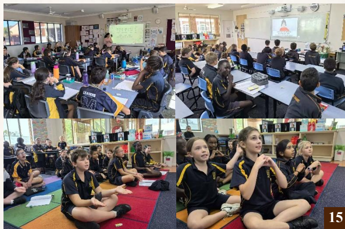
圖 15：同學們積極參與課堂互動，營造了良好的學習氛圍。

為了讓聖明小學的澳洲當地小學生更好的學習中文、了解中華文化，學院法師選取了適合母語非漢語學生的學習教材，著重於培養聽說能力。教師在課堂上根據學生的喜好、年齡及理解能力等因素，因材施教。