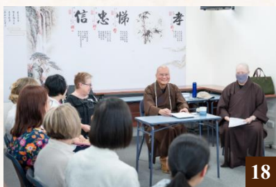
圖 18： 上悟下道法師與校長、教職員座談交流，暢談漢學如何落實於教育體制中。