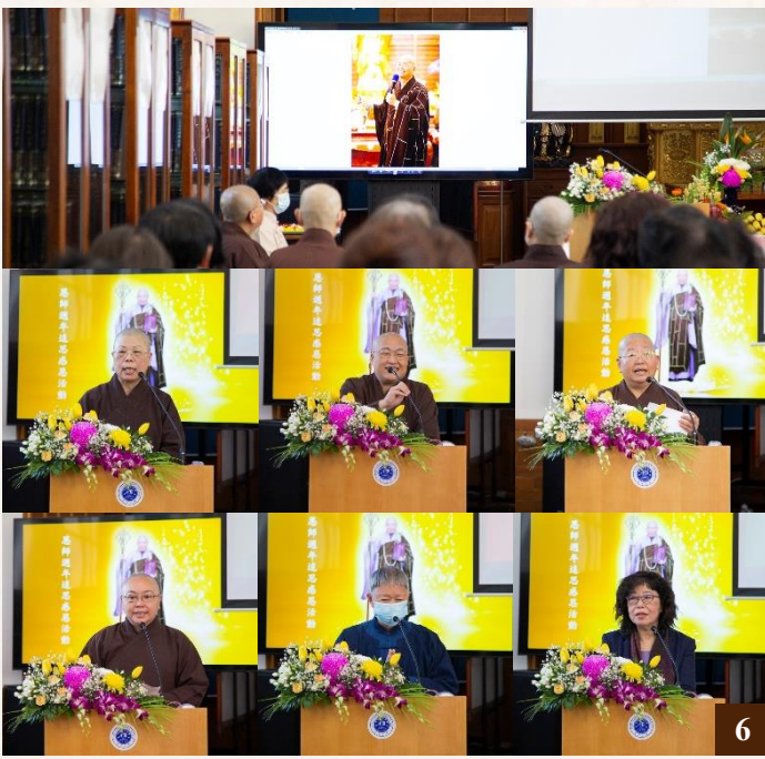
圖6：7月26日上午舉辦追思活動，緬懷老和尚的言傳身教。