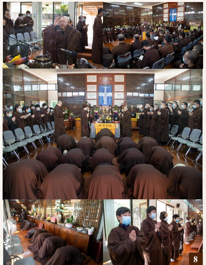
圖8：7月26日下午，淨宗學院於念佛堂舉辦三時繫念法會。法會現場莊嚴肅穆，繫念佛事殊勝莊嚴。