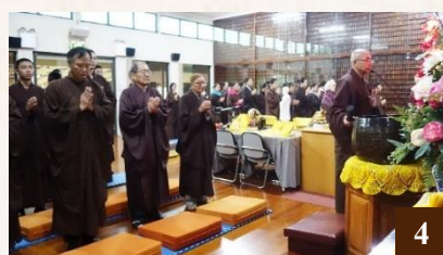
圖 4：上智下揚法師領眾念佛。