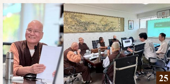
圖 25：11 月 7 日，RBIT 教師共同進行專業發展活動。