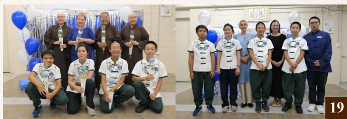
圖 19：明德學校於12月舉行小學畢業典禮，師長們與六年級畢業生歡喜合照，見證學生們的成長。