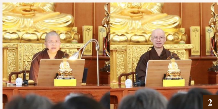
圖 2：上悟下全法師及上悟下勝法師專題習講。

淨宗學院自成立以來，為遵循導師上淨下空老和尚的教誨，禮請法師長駐講經。每週一至週日，進行淨土經典之學習心得分享；部分課程及活動提供網路直播。