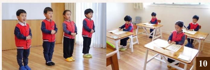
圖10：同學們精神抖擻、威儀有則，專注地吟誦經典。

《弟子規》吟誦是學校每日的課程之一，或坐或站都威儀有則，或齊聲吟誦、或依次交替吟誦，同學們專注安定的眼神、抑揚頓挫的吟誦聲，伴隨著老師清脆的木魚節奏，將經典的聲義充分地體現出來，也進一步增強了同學們讀誦經典的信心。