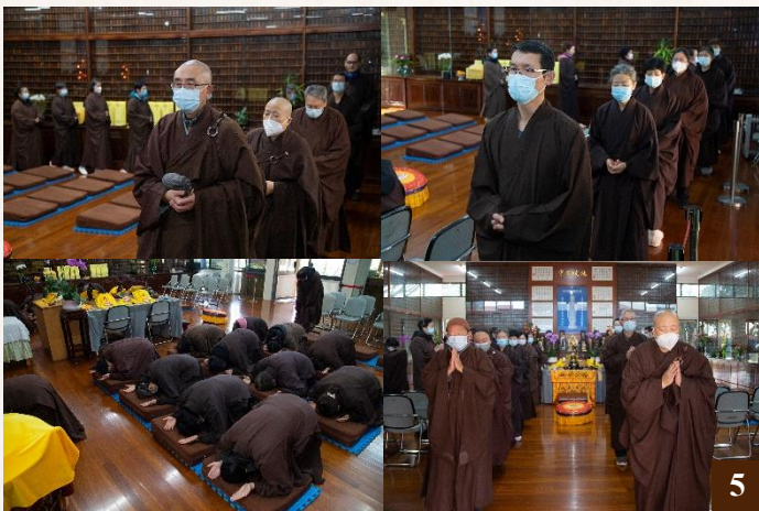
圖5：7月23日至25日，學院法師領眾精進念佛。