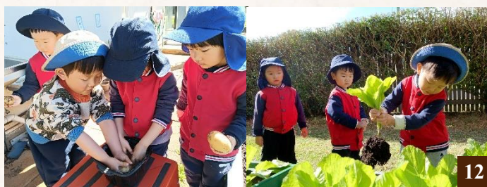
圖12：老師帶領同學們一起播種了白蘿蔔、苦瓜、芥菜、生菜、長豇豆；同學們在老師的示範和幫助下，自己種土豆、給土豆苗澆水、除草，最後一起收穫並品嚐烤土豆。