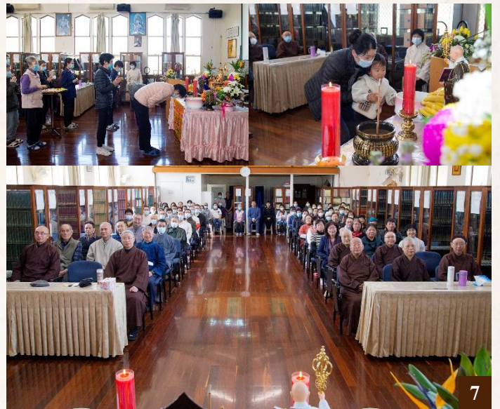
圖7：大眾排隊獻花，向師父上人表達無盡的敬愛與感恩。