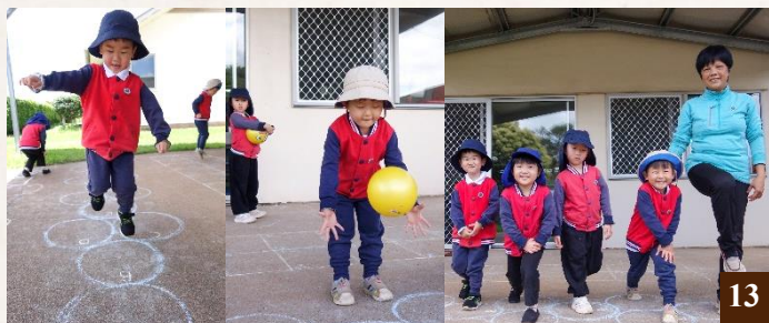
圖 13：在快樂的環境中均衡發展體能、智能、語言等能力。

提升了同學們的專注力和規則意識，讓同學們在輕鬆愉快、自由的遊戲氛圍中快速學會了辨認各種圖形，並數學邏輯能力和英文聽說能力。