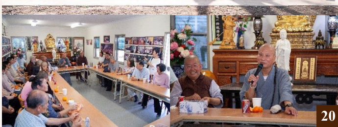
圖 20：2024 年 10 月 19 日，RBIT 漢學系教務主任兼教師 上 悟 下 道法師與淨宗學院及 RBIT 全體師生一同前往古邦吉 (Goombungee) 參觀 上 淨 下 空老和尚紀念塔。